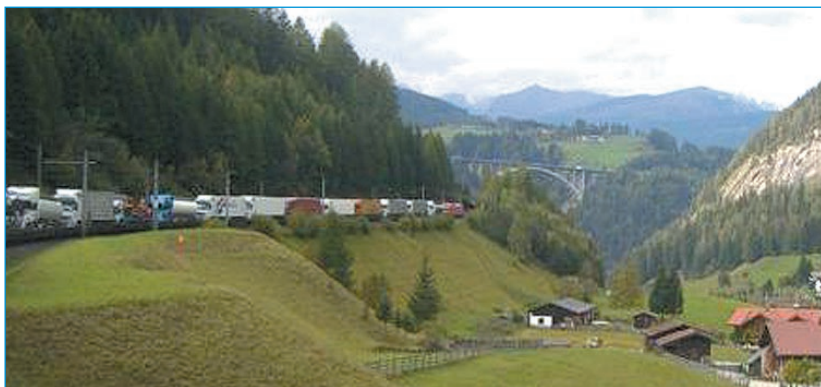
Im Rahmen internationaler Projekte soll die Attraktivität des transalpinen Güterverkehrs gesteigert werden ■

betrault wird, wenn es sonst keine Lösungen mehr gibt. Daher ist das Unternehmen, dem es auch gelingt, privatwirtschaftliches Denken in historisch gewachsenen Verwaltungsstrukturen umzusetzen, an zahlreichen deutschen und europäischen Premium-Projekten beteiligt.