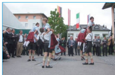
Alle zwei Jahre lädt das Logistik-Kompetenz-Zentrum (LKZ) zum Kongress „Logistik Innovativ“ in Zusammenarbeit mit Bayern Innovativ nach Prien am Chiemsee ein. Fester Programmpunkt von Süddeutschlands bedeutendstem Logistik-Kongress ist der „Bayerische Abend“ ■

gute Ausgangsbasis für weiteres Wachstum im Logistik- und Transportbereich zu schaffen – ganz so wie es die bayerische Staatsregierung in dem überparteilichen Konzept „Zukunft Bayern 2020“ festgeschrieben hat. ■